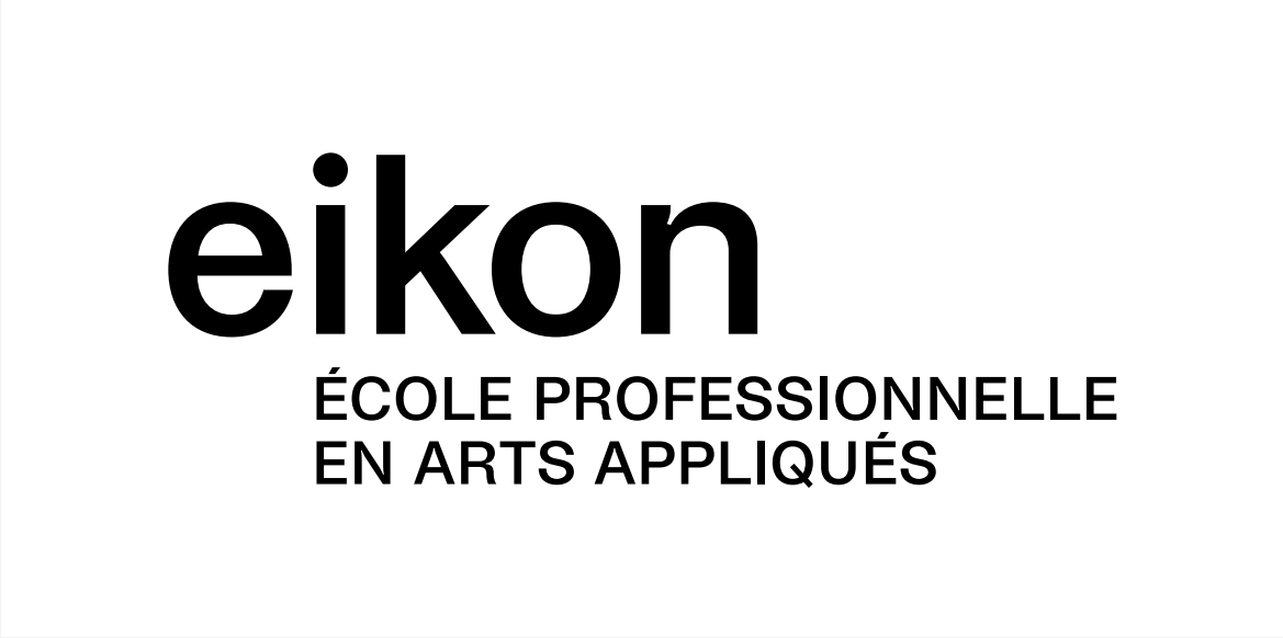
Noir sur blanc