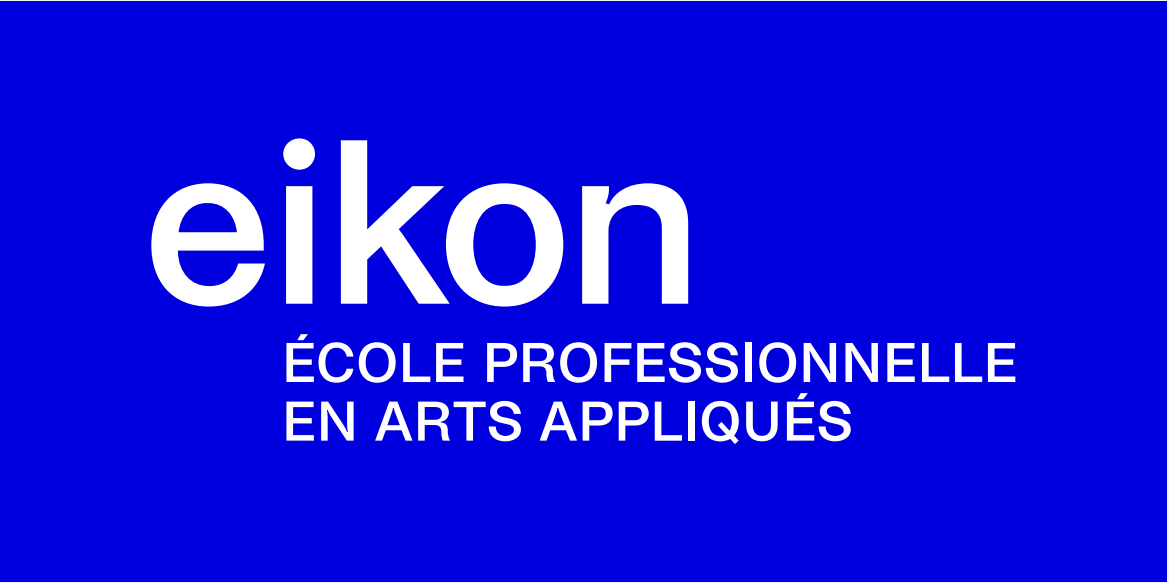
Blanc sur électrique