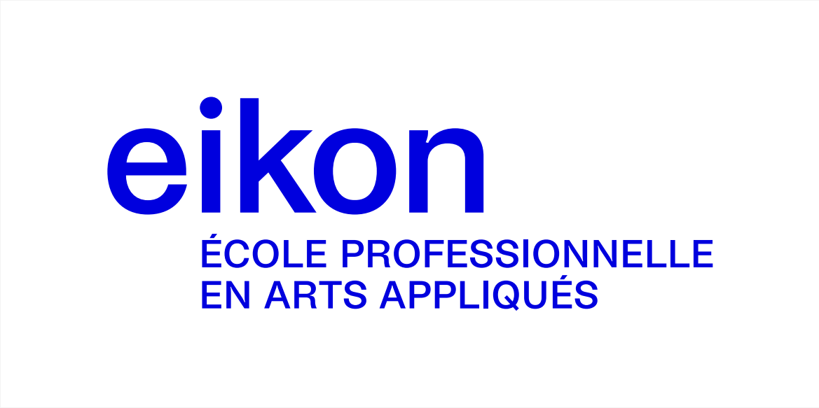
Bleu électrique sur blanc