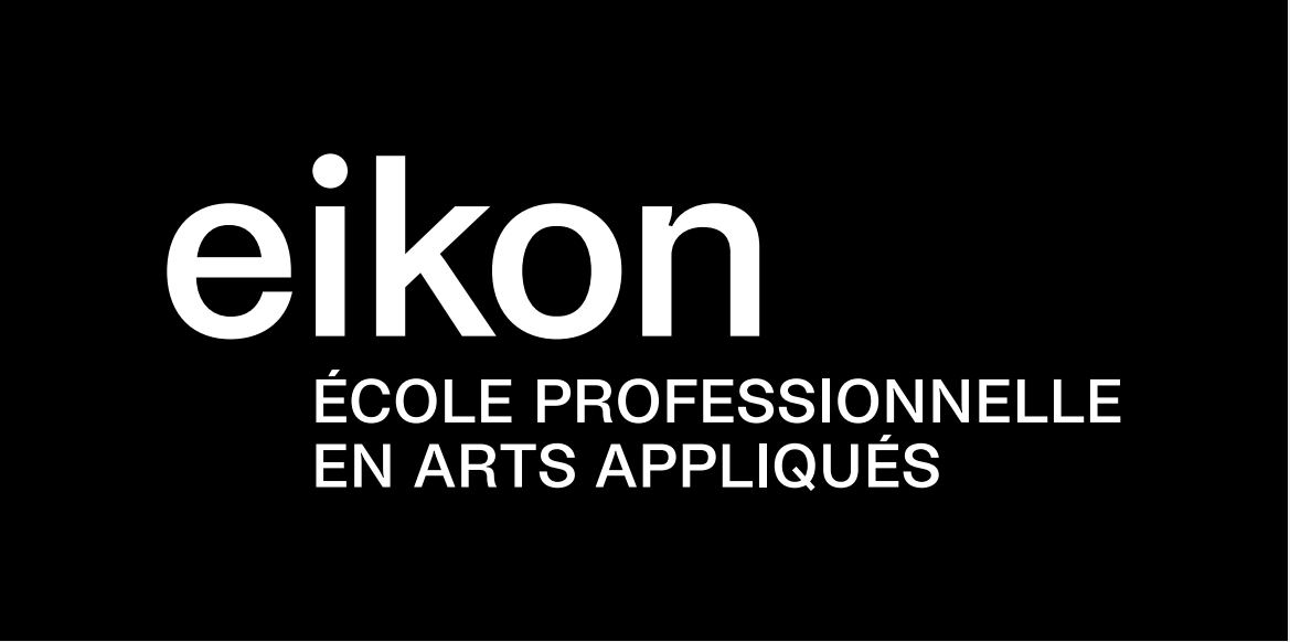
Blanc sur noir